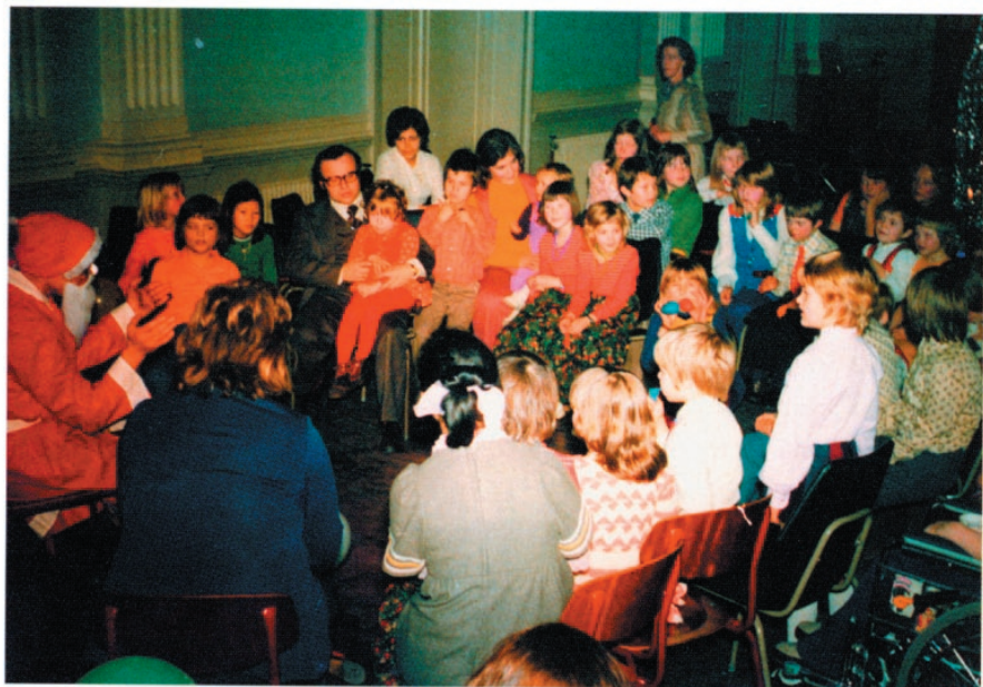
Fra den årlige julefesten i CP-foreningen.