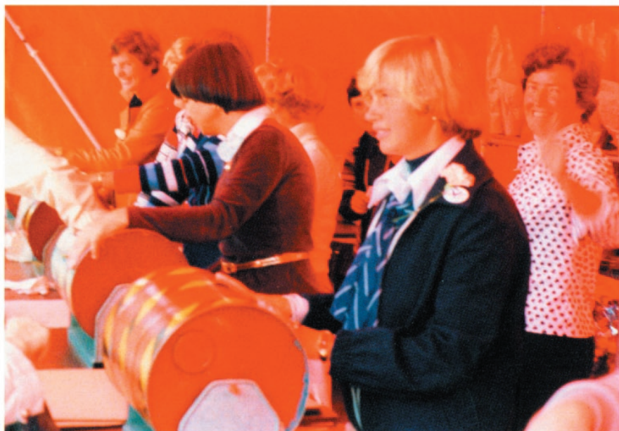
Blomstertombolaen ruller i teltet.

Ut på dagen var det blomsterteltet på Festplassen som var sentrum for virksomheten. Her drev foreningens damer tombola og utlodning av potteplanter og buketter. Det var et svært arbeid å få opp teltet om morgenen, og enkelte år når vi var uheldig og fikk regnvær, kunne det bli mye lekkasje. Derfor måtte foreningen i 1970-årene skaffe seg et nytt telt, spesialkonstruert med et rørsystem som var enklere å montere. Teltgjengen - en gruppe med foreldre, ble etter hvert ganske proffe på teltmontering. Blomsterdagen kunne gi foreningen en inntekt på mellom 40 til 60. tusen kroner hvert år. Det var en virkelig kraftanstrengelse for medlemmene i