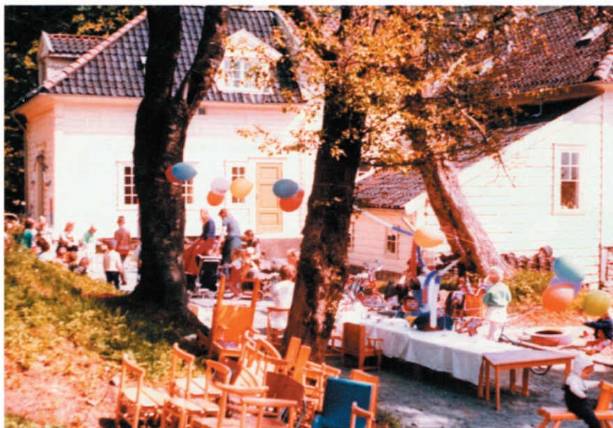
Sommerfest på Fagerås Gård.

I løpet av årene i Fageråsen utviklet foreningen et godt dagtilbud for funksjonshemmede barn som i sin helhet kunne flyttes over til den større institusjonen som var under planlegging.