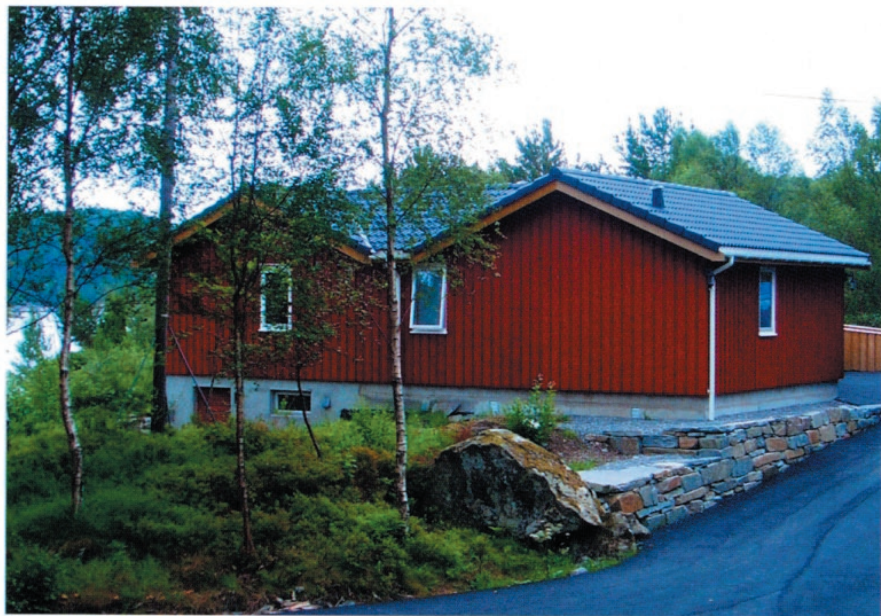
CP-foreningens feriested i Sveio - ferdigbygget 2005.