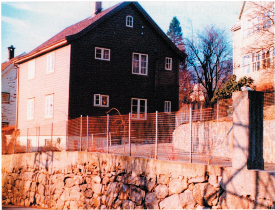
Huset i Løbergsalle ble innredet til det første daghjem for c.p.barn i Bergen

Så endelig i 1959 kunne det første daghjem for barn med cerebral parese åpne i Bergen, og foreningen hadde dermed nådd sitt første mål. Men kapasiteten i Løbergsalléen var ikke så stor, 8 – 10 barn var det meste en kunne klare i de beskjedne lokalene. Behovet var langt større, og mange barn sto på venteliste i 1960- årene.