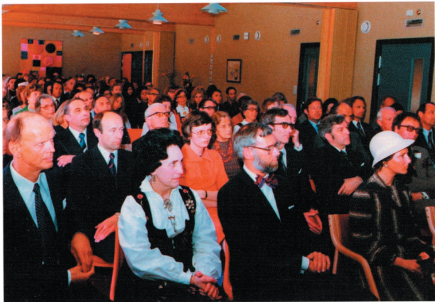
Fra åpningen av Vestlund Behandlingssenter 1975.