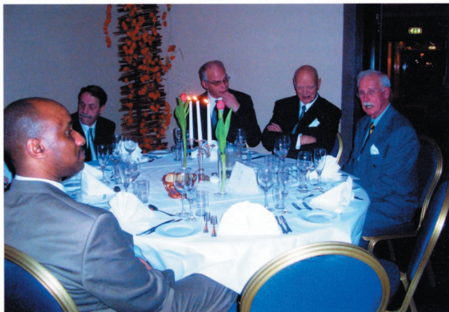
Fra 50-årsfest i Bergen november 2004.

andre interesseorganisasjoner vært med å påvirke. Mange medlemmer har vært brukerrepresentanter i offentlige råd og utvalg. Foreningen har og vært pådriver i forhold til det offentlige for å få gjennomført krav til livsløpsstandard og tilgjengelighet i bolig- og andre utbyggingssaker. Vi har også gitt økonomiske bidrag til spesialavdelinger ved skoler og til bofelleskap for velferdstiltak.