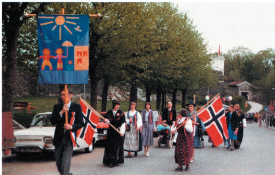
Barn og foreldre fra Undervisningscenteret Nordnes på vei til 17. mai toget

I løpet av 1970-årene kom det ny lov om integrering av funksjonshemmede i det lokale skolemiljøet, og skolene generelt fikk resurser til å gi mer spesialundervisning. Men Undervisningscenteret på Nordnes ble ikke overflødig, og gir i dag skoletilbud til de funksjonshemmede som fungerer svakest og ikke kan nytte seg av lokalskolen..