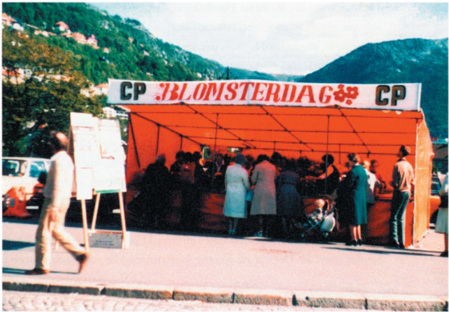
Vårt nye telt på Festplassen var senter for Blomsterdagen.

”Knapphullsnelliken”, Arrangementet med salg av knapphullsnelliker fra CP-foreningen begynte egentlig i Øst-Norge i 1950-årene, og ble startet opp i Bergen få år etterpå.