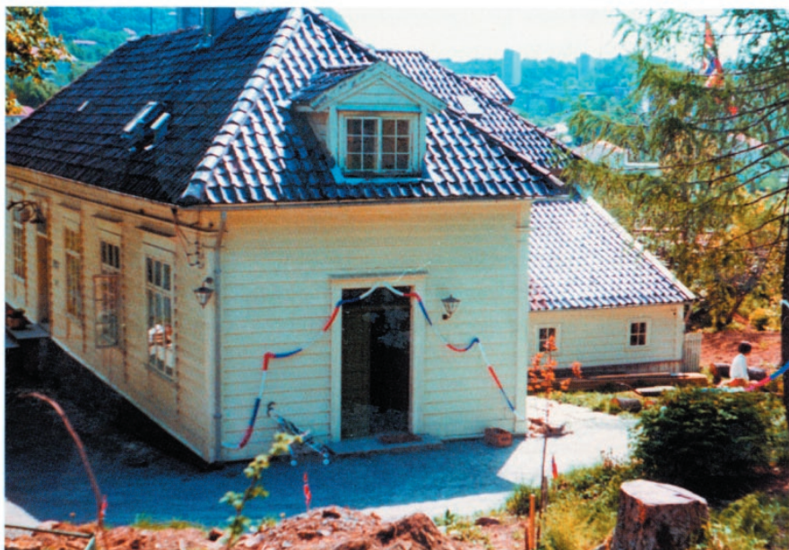
Fagerås Gård ble ombygget av CP-foreningen til behandlingsinstitusjon og daghjem.

gamle huset kunne tas i bruk til sitt nye formål. I den gamle hagen ble det ryddet plass til et fint lekeareal.