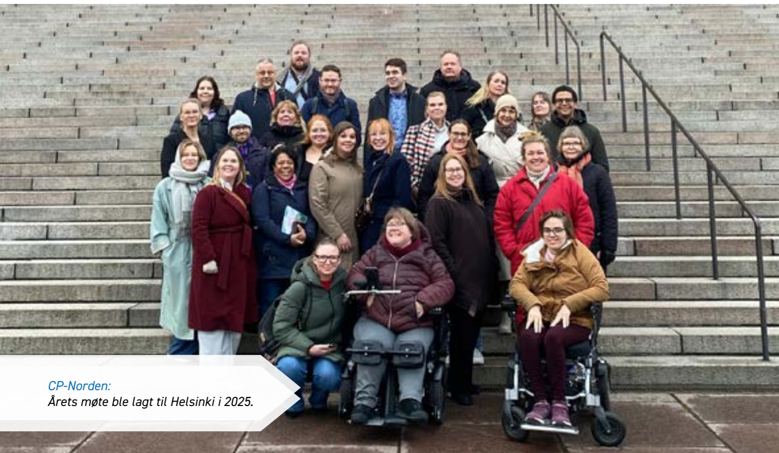
CP-Norden: Årets møte ble lagt til Helsinki i 2025.

Prosjektperioden strekker seg fra 2024 - 2026, og det er innvilget totalt 1 500 000 kroner til prosjektet. Det ble utbetalt 625 000 kroner til prosjektet i 2025. Prosjektleder er Asbjørg Stray-Pedersen ved Oslo Universitetssykehus.