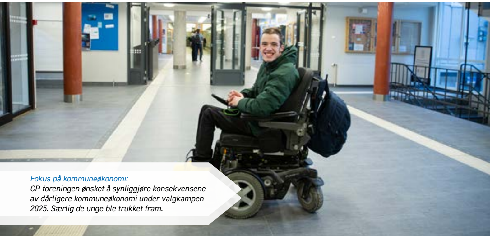
Fokus på kommuneøkonomi: CP-foreningen ønsket å synliggjøre konsekvensene av dårligere kommuneøkonomi under valgkampen 2025. Særlig de unge ble trukket fram.